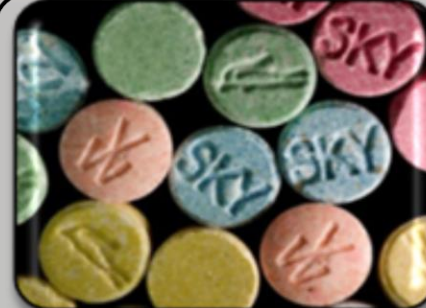
Галлюциногены ЛСД DragonFly мескалин, псилоцибин